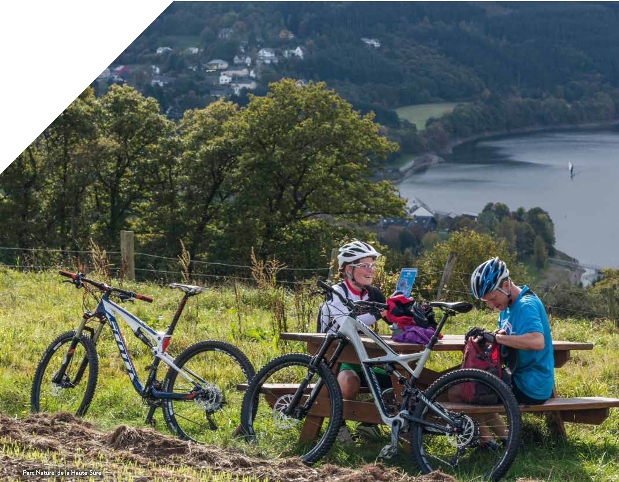
Parc Naturel de la Haute-Sûre

Enthusiasts of active holidays will find a multitude of leisure activities to pursue whilst in Luxembourg. Cycling and hiking tours make you discover the most beautiful sceneries. From climbing to nautical sports and aviation or golf; being active in Luxembourg combines physical challenge with entertainment for both, young and old. At the end of a hard day, you'll find wellness, health and spa centers throughout the country that offer a moment of pure relaxation.