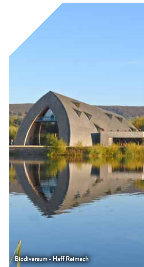
Biodiversum - Haff Reimech