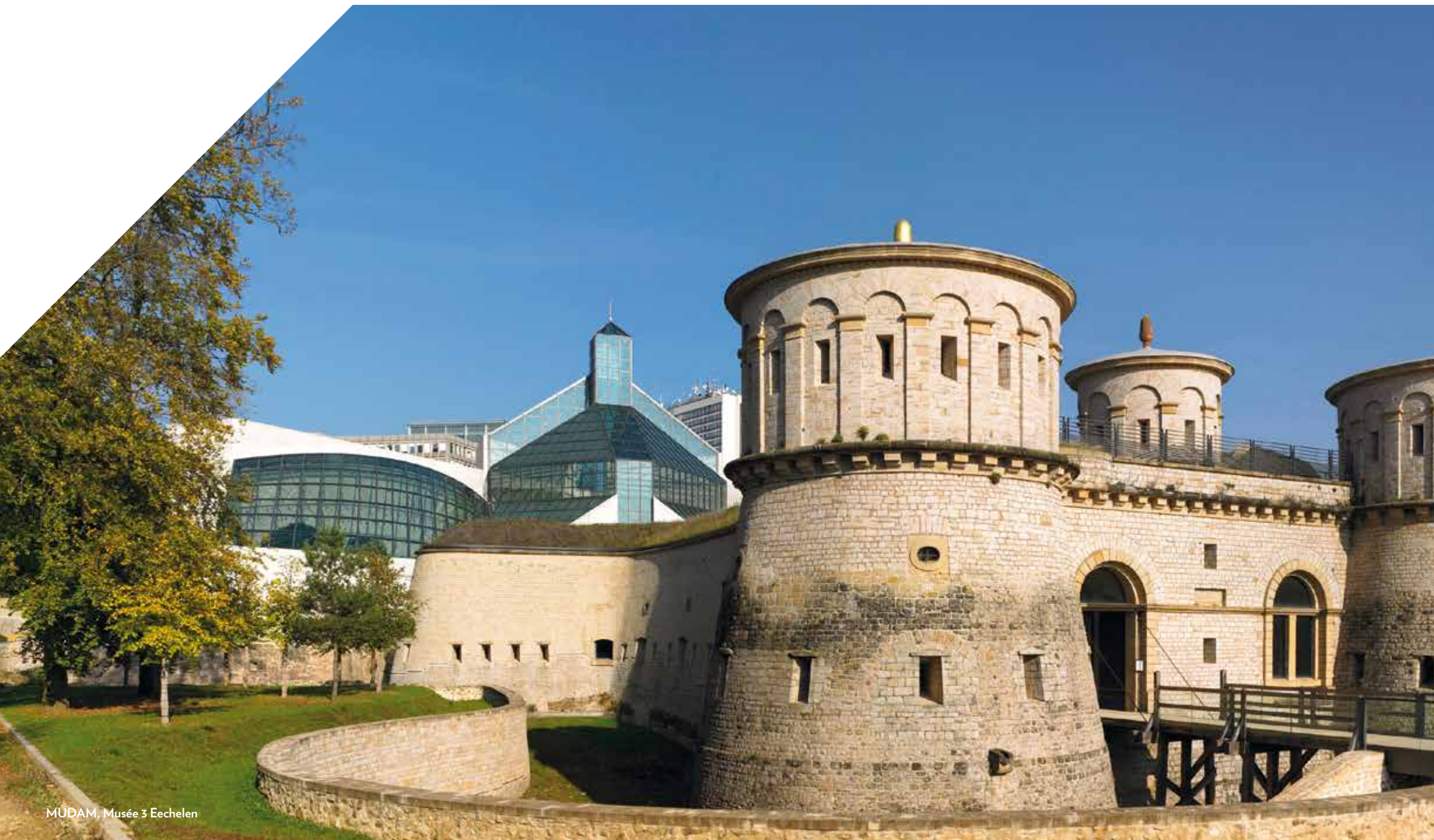
MUDAM, Musée 3 Eechelen