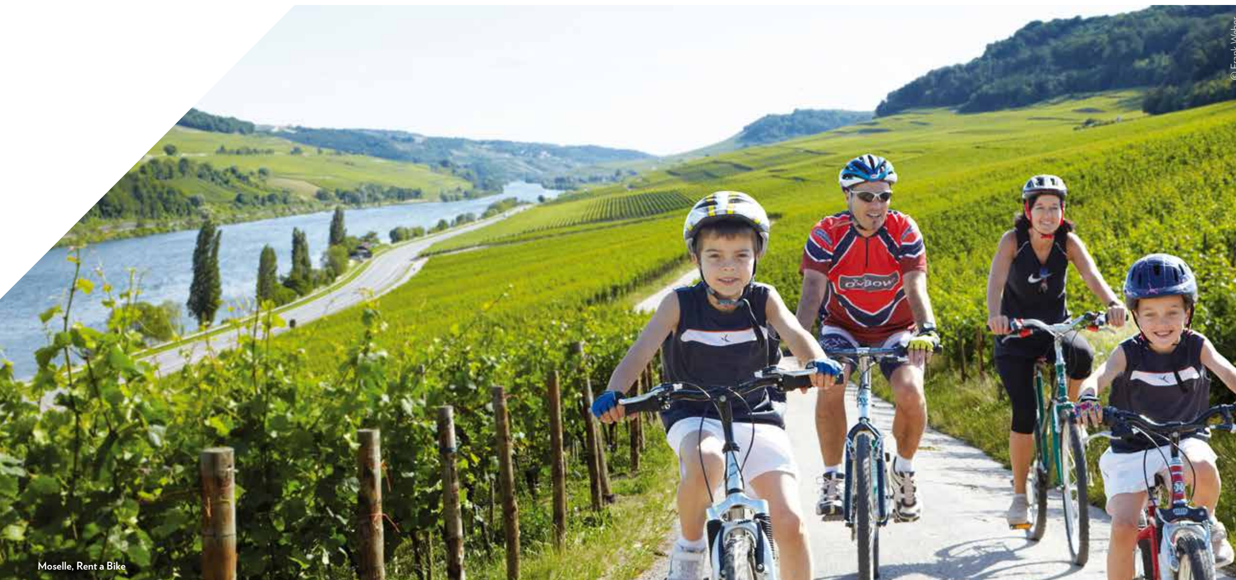
Moselle, Rent a Bike