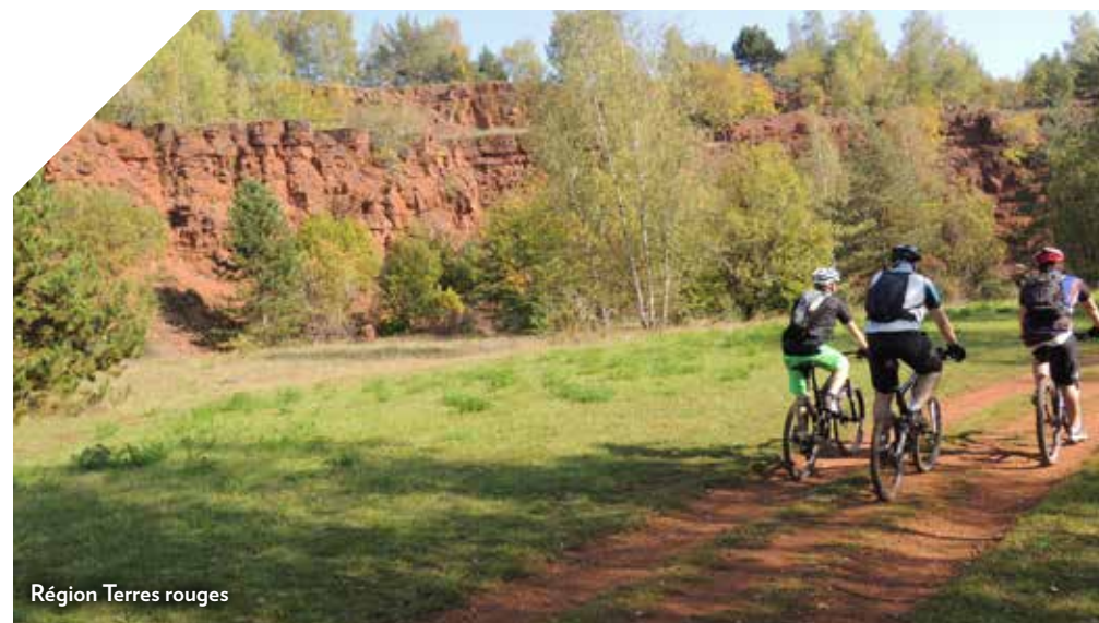
Région Terres rouges

Between plains and woods, with lakes and rivers, Luxembourg's landscapes are enchanting as well as fascinating. Nature in Luxembourg also means to discover unexpectedly a picturesque village, a mysterious ruin or just a breathtaking landscape behind every turn. Rock formations, meandering streams or colourful flora - nature in Luxembourg still knows some untouched spots by mankind. Between family tours, hiking or romantic excursions, Luxembourg has plenty of natural space waiting to be discovered, the whole year through.