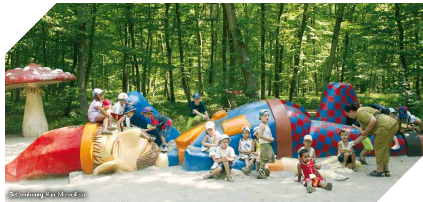
Bettembourg, Parc Merveilleux

The choice is enormous! Scattered upon its 2,586 km 2 , Luxembourg offers a multitude of leisure activities for children of all ages. From city trains to chairlifts, from climbing parks to the exploration of former mine shafts, activities with children and youngsters become a great adventure. Many leisure activities for children are offered throughout the year, regardless of the weather. One of Luxembourg's great talents consists in touristic offers that perfectly combine didactic effects with fun and action. For example, children can participate in instructive workshops and learn respectful relationship with nature.