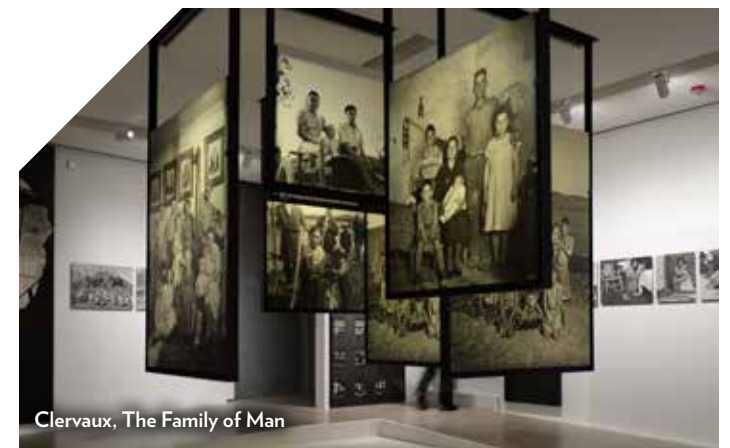
Clervaux, The Family of Man