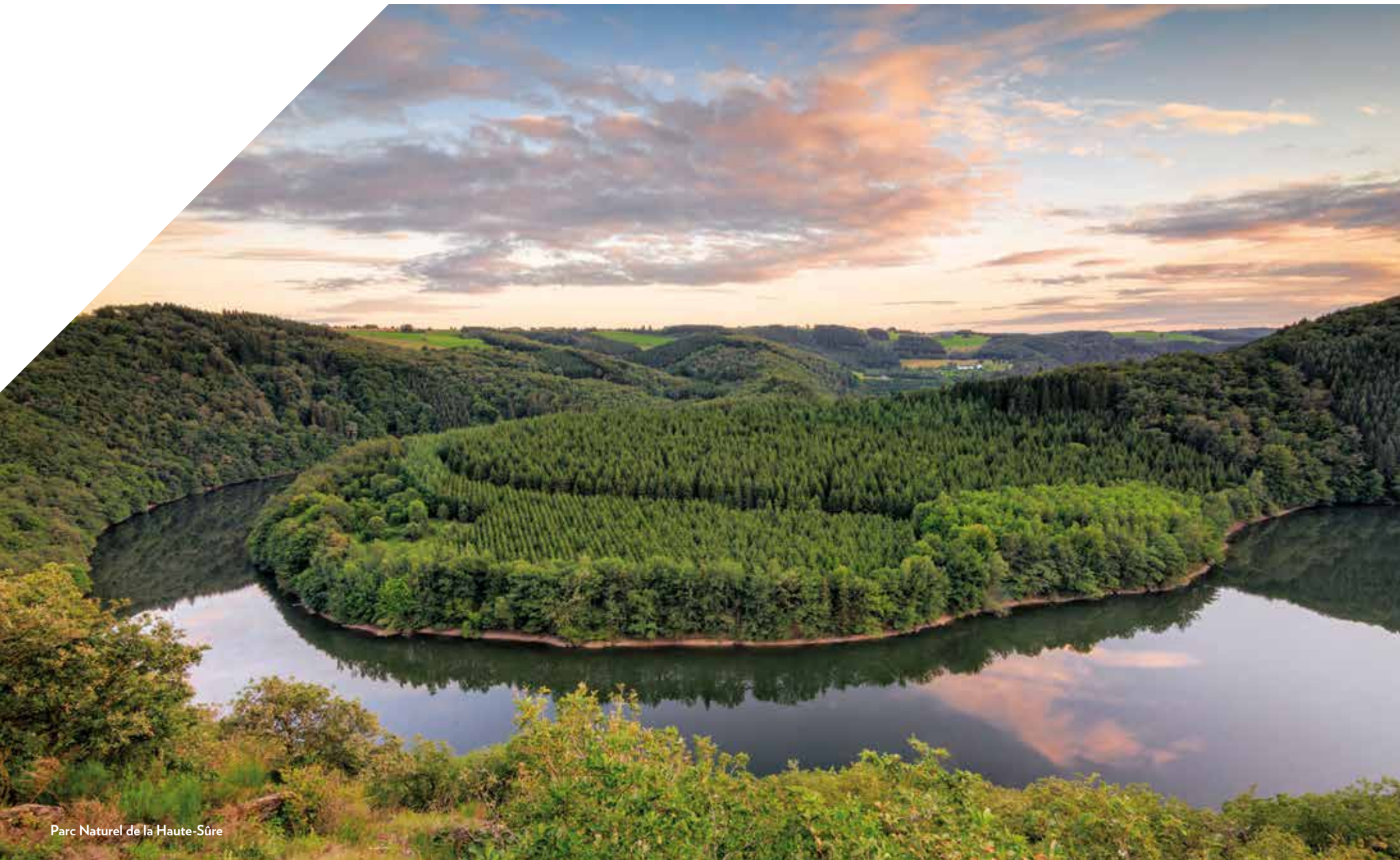
Parc Naturel de la Haute-Sûre