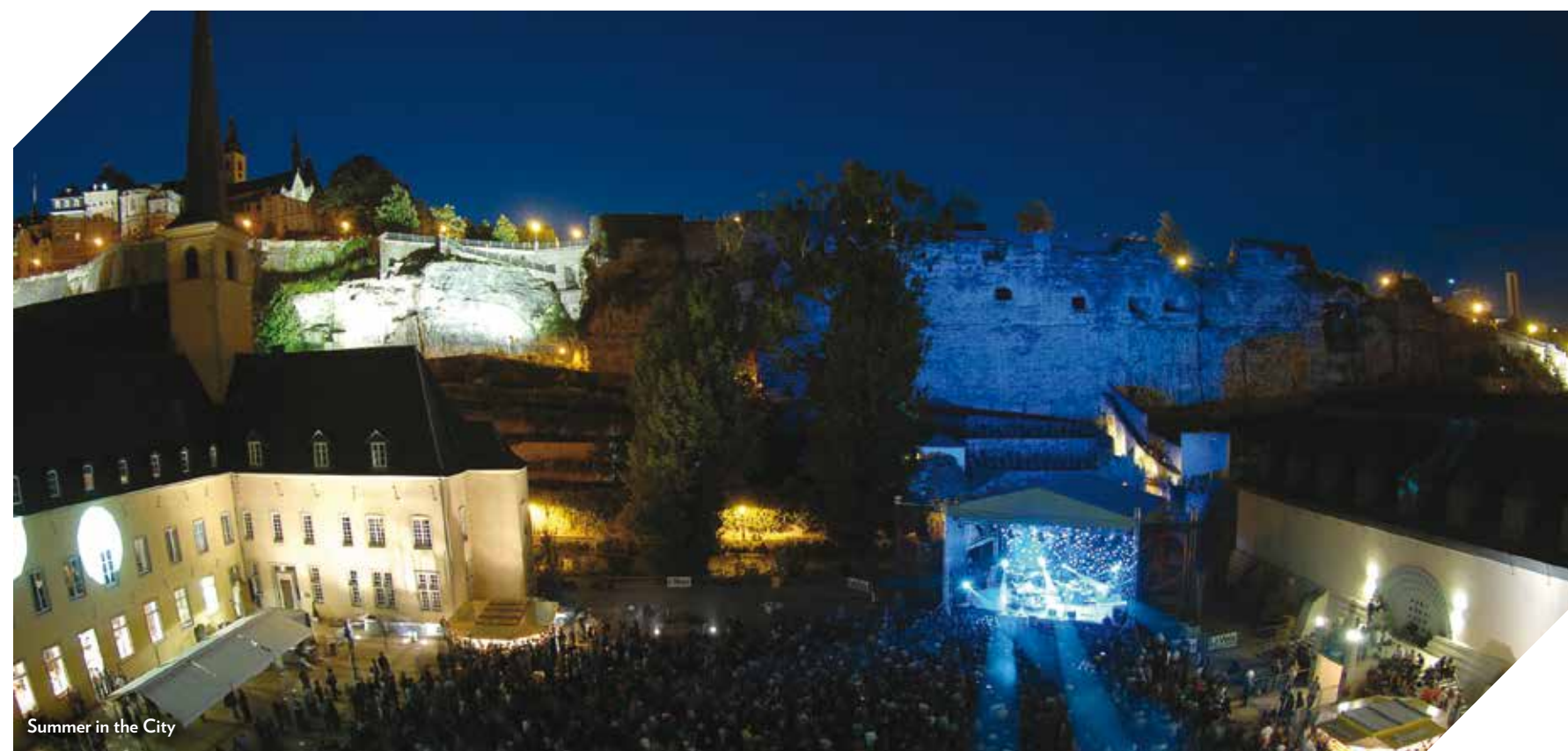
Summer in the City

Luxembourg offers a wide variety of nightlife that suits diverse tastes. Out of ideas for tonight's plans? Let's make a few suggestions: the first course will consist of an exquisite meal in one of Luxembourg's restaurants; as a main course, our agenda would like to suggest a varied offer of concerts, theatres and dance performances. After a drink or two in one of Luxembourg's trendy bars, the dessert will be served up in full club mode with a fantastic array of options on hand.