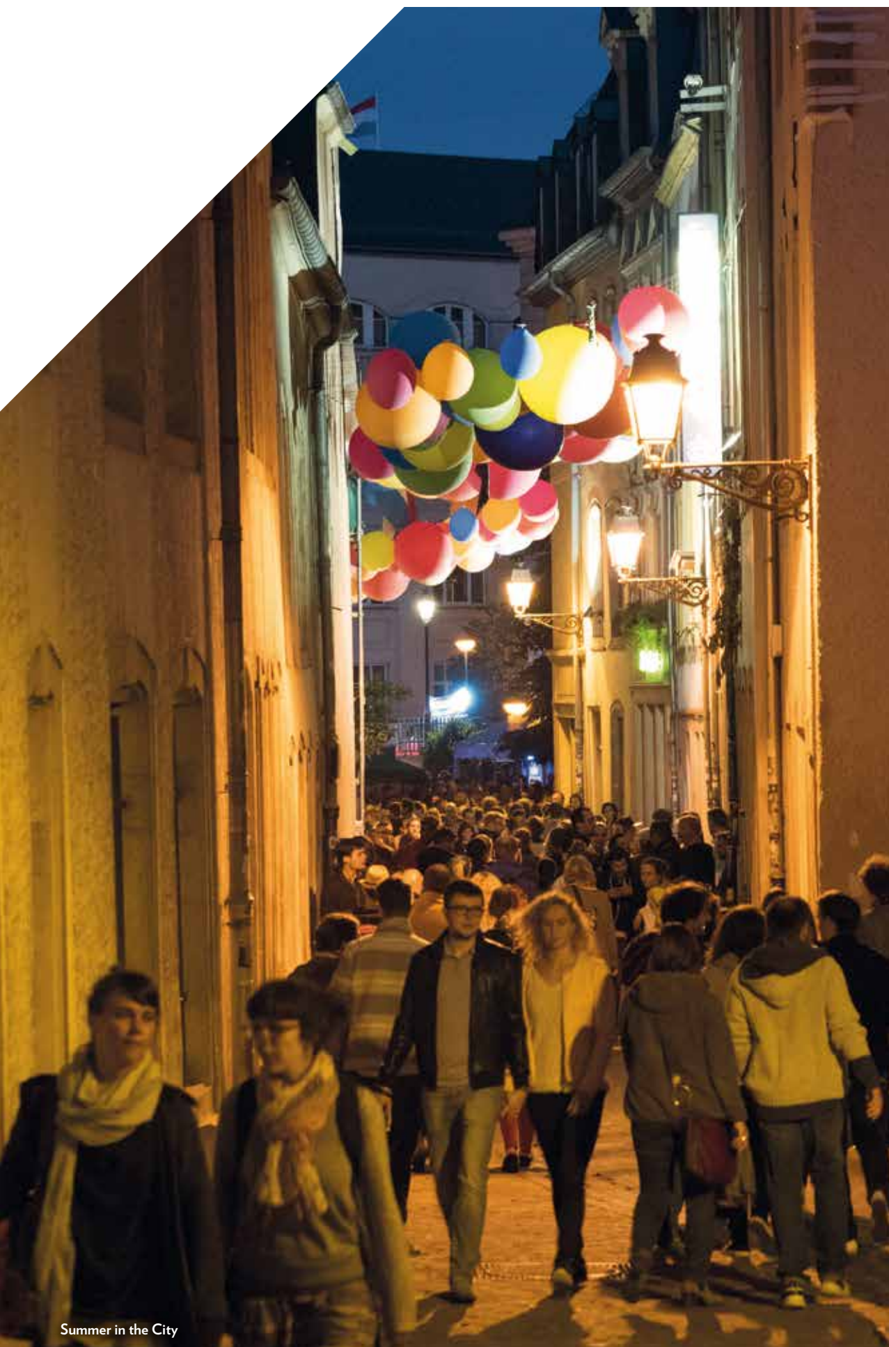
Summer in the City