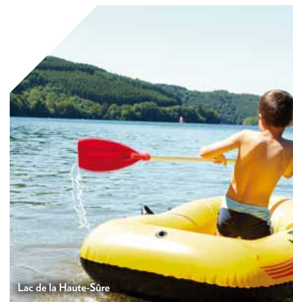
Lac de la Haute-Sûre